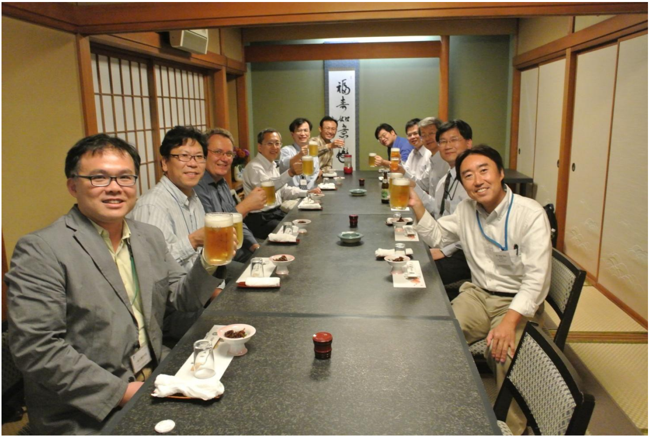
與 RIKEN 研究員餐敘